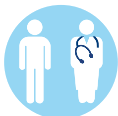
Nutzung ambulanter Behandlungsmöglichkeiten

Sicherheit hat im Krankenhaus gerade jetzt in Zeiten der Corona Pandemie eine besonders hohe Bedeutung.