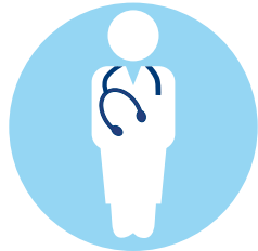
Speziell geschultes Personal