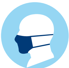
Maskenpflicht und Besuchsregeln