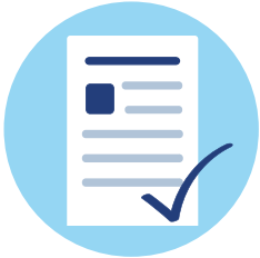
Corona-Tests als Standard für jeden Patienten