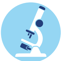
Stiftungseigenes Kompetenzzentrum Mikrobiologie & Hygiene